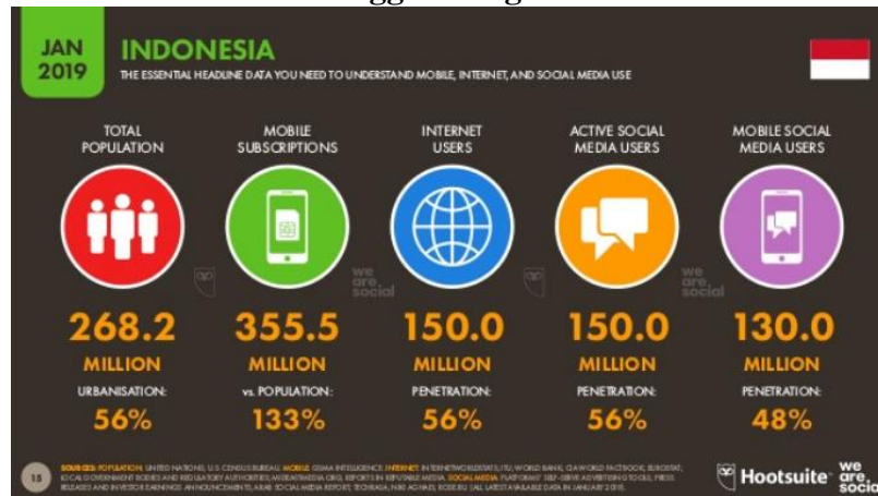
Gambar 1. Pengguna Digital di Indonesia