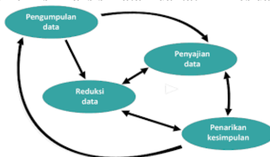
Gambar 2. Teknis Analisis Data Kualitatif Miles dan Huberman